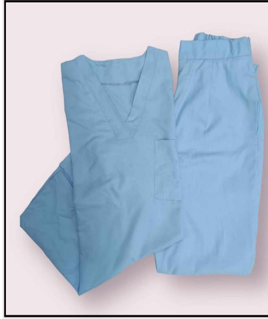
1- نموذج لبدلة طبيب